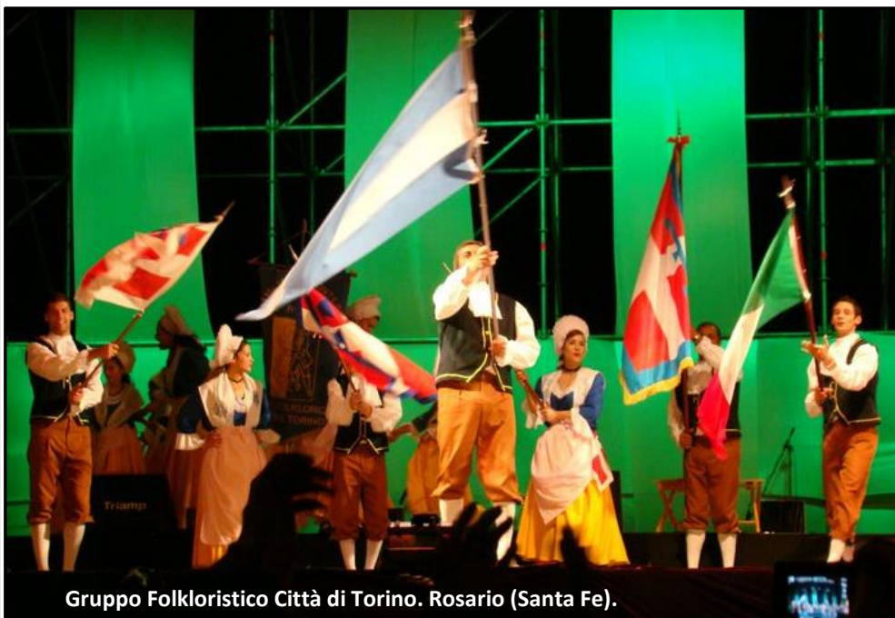
Gruppo Folkloristico Città di Torino. Rosario (Santa Fe).

I baj a van daj moviment dij salon dla Cort fin-a ij pi popular ch'as fassio ant le piase. Ant le campagne a mostra la vita dle famije ch'as radunio pèr mangé la polenta con el bon vin o pèr fé la tradissionale vëndèmia. Grassie a la conformassion ed sò spetàcol e a la motivassion daj sò integrant pèr difonde la coltura piemontèisa a l'han fait che el grop "Città di Torino" dla Associassion Famija Piemontèisa e 'd Rosario podèssa partecipè 'nt pi 'd 600 feste coturaj.